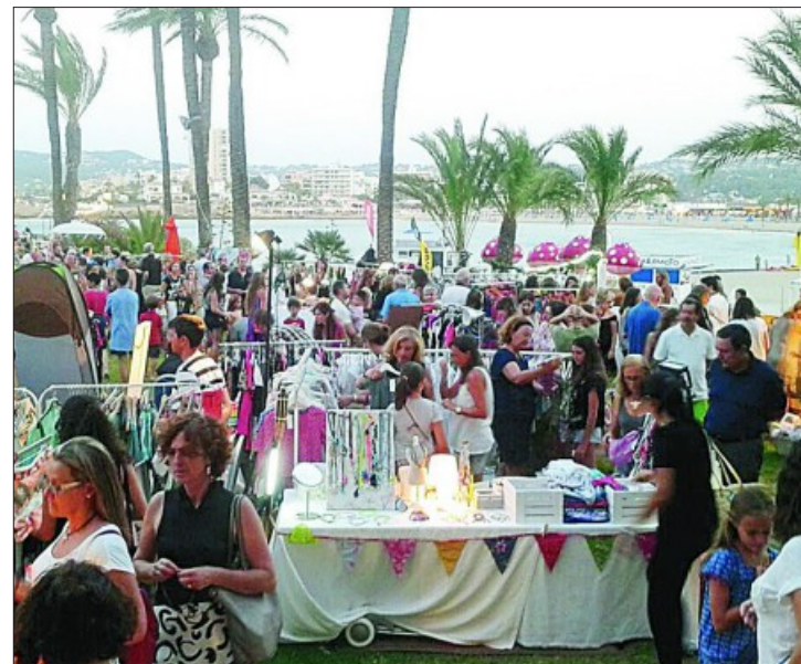
El «It Market» celebrado en Jávea

Altea también tendrá su «It Market» este verano. Este singular mercadillo se instalará en el puerto deportivo Luis Campomanes de la localidad del 21 al 23 de agosto. La acogida en el Parador de Jávea de los 57 puestos que componen el «It Market» ha sido todo un éxito, según afirman desde la organización. Tanto que pronto ha encontrado otro destino excepcional para la segunda quincena de este mes. En la localidad alicantina de Altea volverán a estar presentes los productos más «it» de bisutería, ropa, detalles para el hogar, arte... Todo acompañado de una oferta irresistible de restauración.