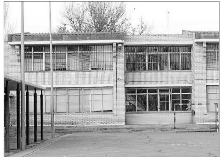
El niño estaba escolarizado en el colegio Baladre de Sagunt. D. TORTAJADA

El protocolo contra el absentismo escolar impulsado por la Fiscalía de Valencia ha sido «muy bien acogido» por la mayoría de los municipios de la provincia de Valencia. Las comisiones de absentismo dependientes de los servicios sociales de cada ayuntamiento son las que alertan a la Fiscalía de Menores de los casos. El ministerio público interpone