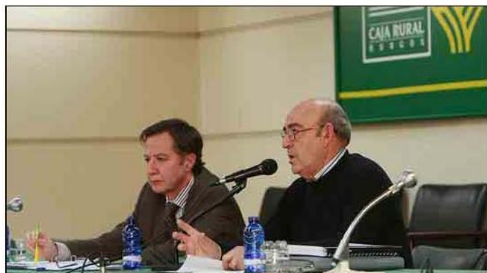
R. GIL / OHPK

28 de septiembre al 1 de octubre, según ha podido conocer este periódico. Este encuentro que servirá para el debate y la reflexión tendrá lugar unos meses antes de que se celebren las elecciones generales, que podrían convertirse en un punto de inflexión en la idea del cierre de la central nuclear de Garoña. Página 7